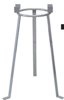
■ FZ-1750 専用スタンド (別売り)