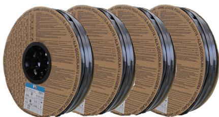
220m 巻 × 4 巻セット